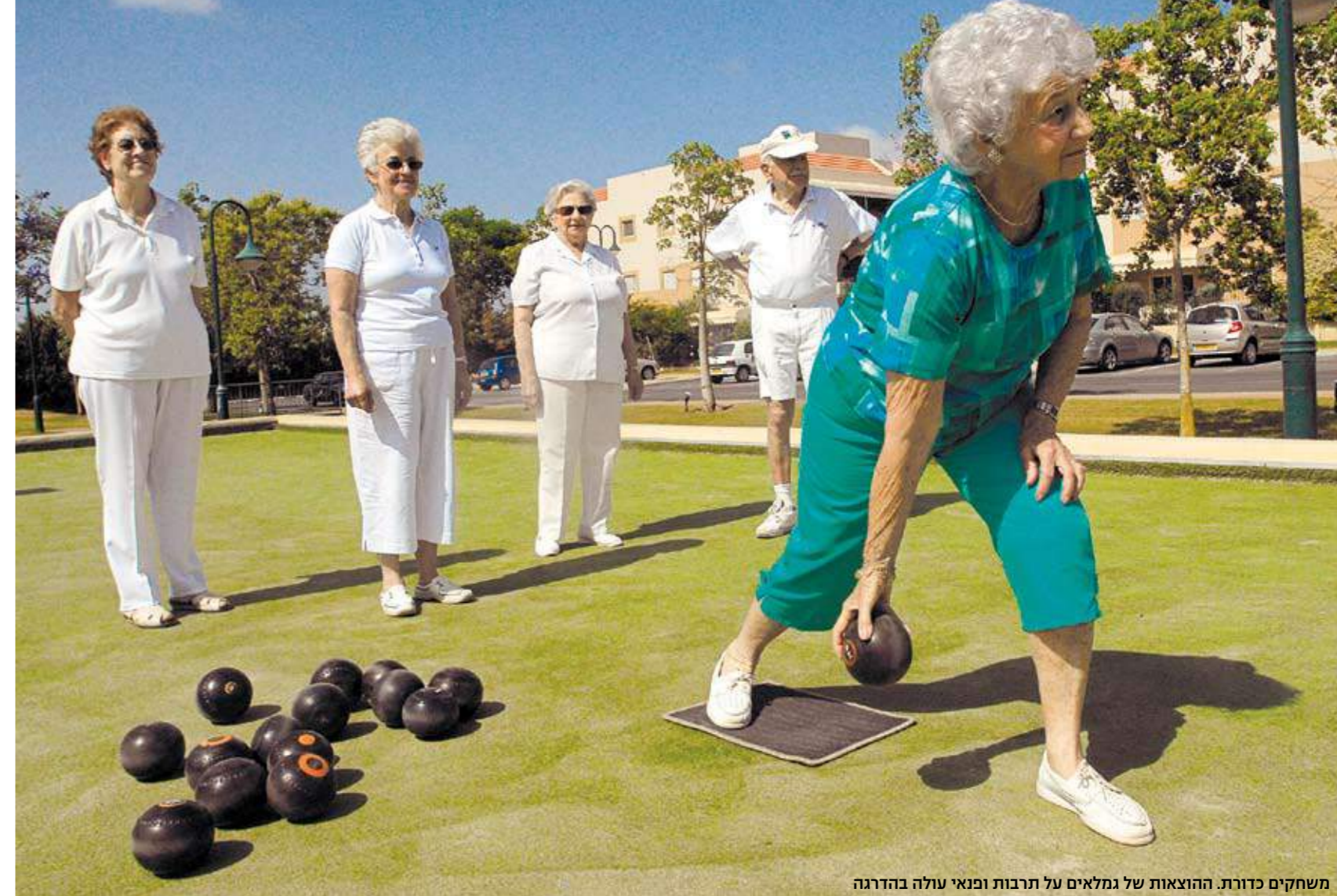
משחקים כדורת. הוצאות של גמלאים על תרבות ופנאי עולה בהדרגה